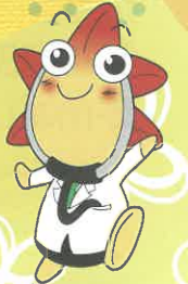
広島県医師会 イメージキャラクター もみじ医