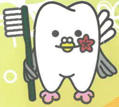
広島県歯科医師会 イメージキャラクター はっぼくん