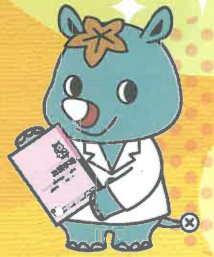
広島県薬剤師会 マスコットキャラクター ヤフザイクン