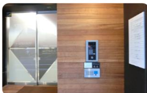
〈 1階 入口インターホン 〉