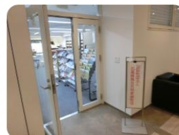
〈 10階入口 〉

《 問合せ 》 広島県ナースセンター 〒730-0803 広島市中区広瀬北町9-2 ☎ 082-293-9786