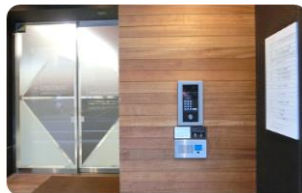
〈 1階 入口インターホン 〉