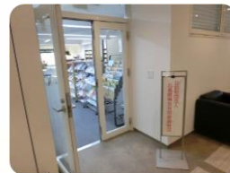
〈 10階入口 〉