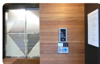
〈 1階 入口インターホン 〉