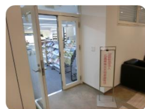
〈 10階入口 〉

※ 厚生労働省 新型コロナウイルス感染症対応看護職員等の人材確保事業「看護職員離職防止相談事業」による相談です。